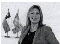
Consejera Regional Paola Cortes , Presidenta comisión de Régimen Interno Provincia de Elqui